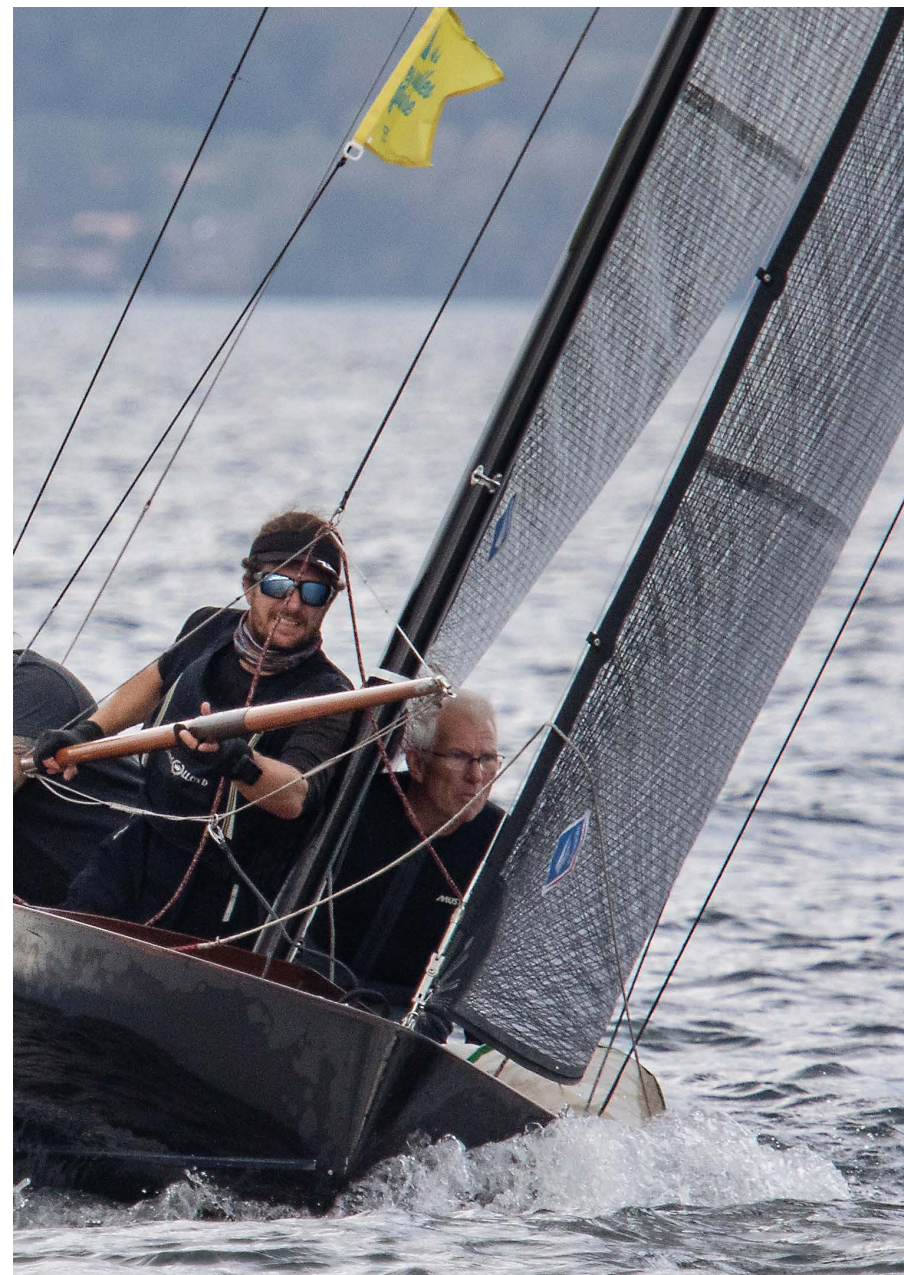
//////////////////////////////////// Un équipage rodé à bord du superbe 6.5 SI, Zoulou, et un envoi de spi à quelques longueurs de bateau.