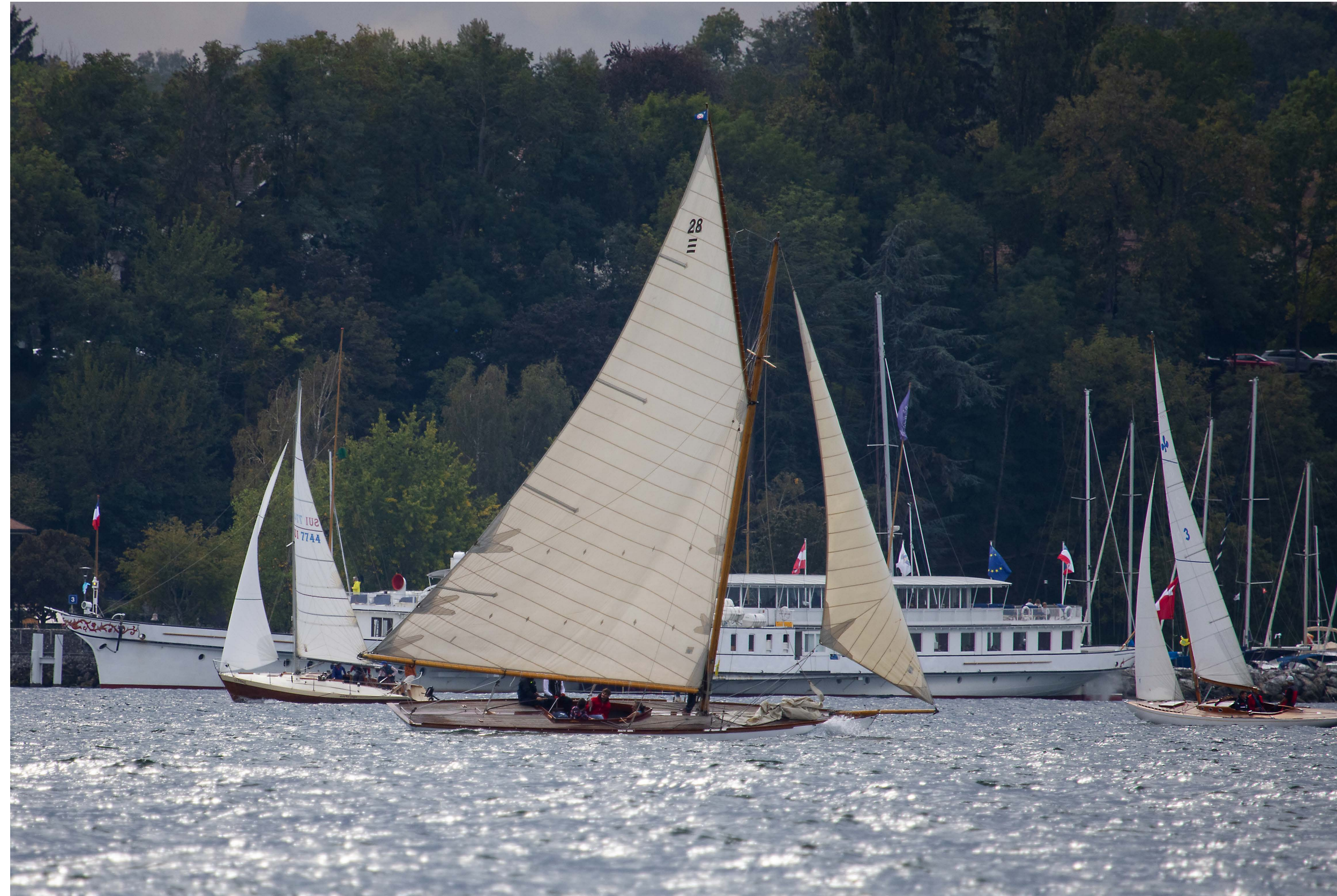
//////////////////// Le Star Athos est gréé en houari, comme il l'était entre 1911 et 1914. Il croise derrière le 6.5 SI Danae. Calypso, le 3 Tonneaux Godinet, en bâbord amure et le Lacustre Albaran, en tribord amure, devant le port d'Yvoire.