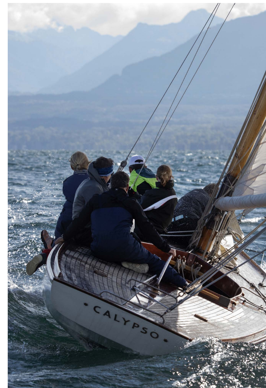
//////////////////////////////////// Au rappel à bord du 3 Tonneux Godinet Calypso qui développe toute sa puissance au près.