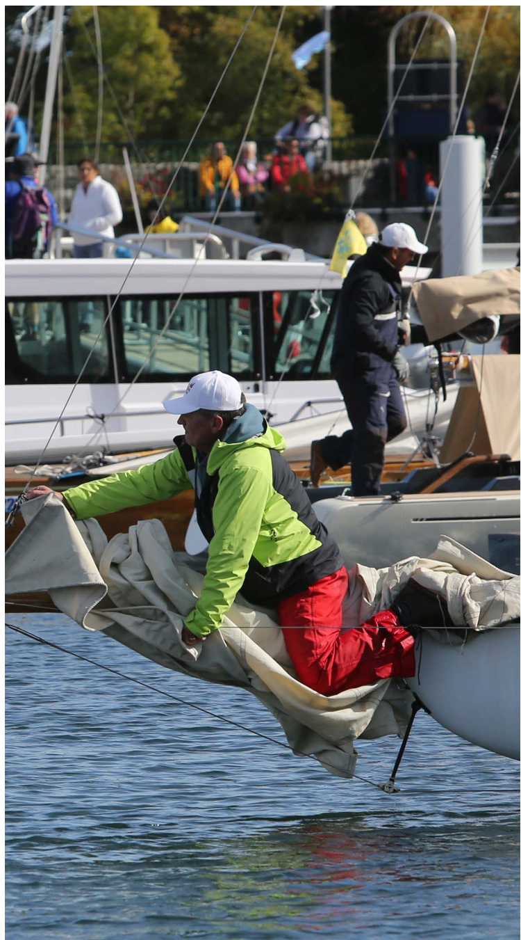
//////////////////// Dès le petit matin, le port d'Yvoire est en émoi. Les équipages s'affairent, effectuent les derniers réglages et préparations qui seront décisifs. Bonne nouvelle : le vent se lève !