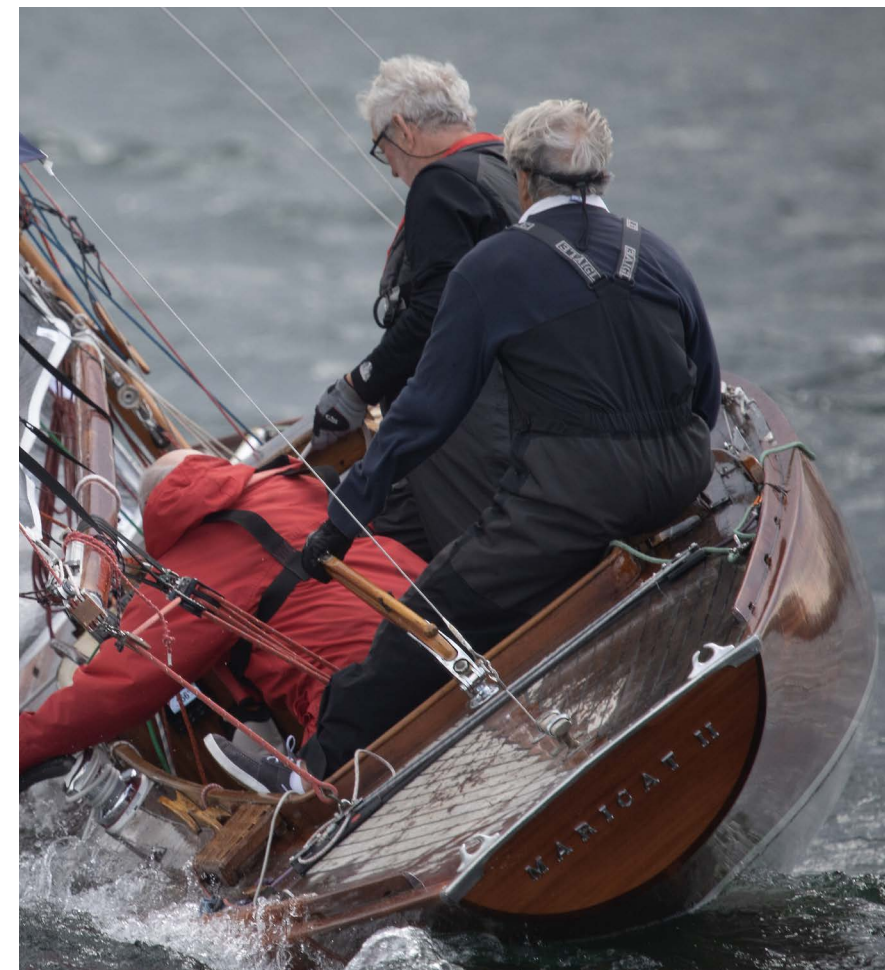
//////////////////////////////////// L'adrénaline et l'esprit de compétition animent l'équipage du Requin Maricat II pris dans une gîte de folie.