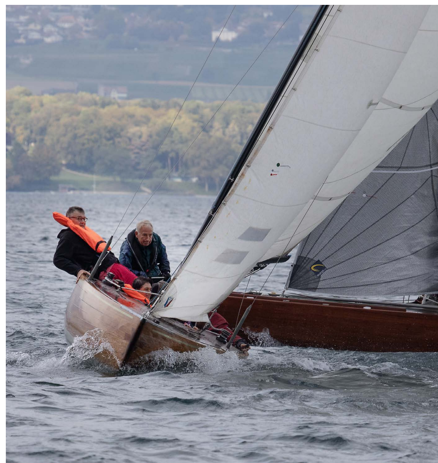
//////////////////////////////////// Affuté, l'équipage du 5.5 M JI Dongfeng vire devant le Requin Maricat II dans le premier bord de près de la régates.